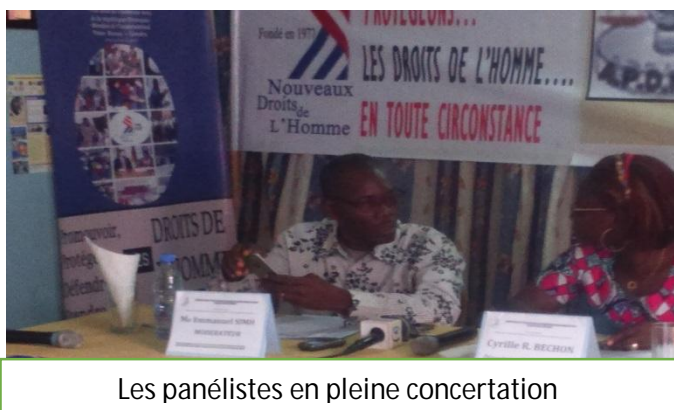
Les panélistes en pleine concertation

Dans ce sillage, l'objectif général du point de presse était d'informer la communauté nationale et internationale sur les positions de la Société Civile camerounaise sur la situation des droits de l'Homme dans la lutte contre le terrorisme au Cameroun. En plus de partager la position de NDH et de ses partenaires, sur les droits de l'homme dans la gestion de la crise dans les régions suscitées, il était davantage question d'édifier les participants sur la place des jeunes dans la stratégie gouvernementale de lutte contre