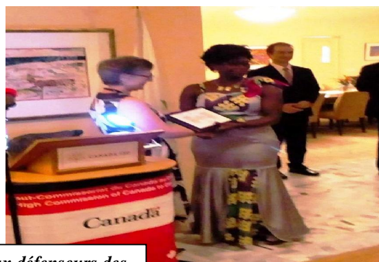
Remise solennelle des pris aux défenseurs des droits de l'homme du Cameroun