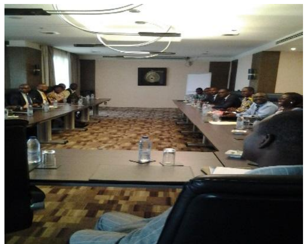
Table ronde présentant l'ensemble des convives invités à la séance d'échange

Cette rencontre d'échange avait pour objectif d'évaluer avec l'ensemble des partenaires camerounais, les conditions générales de préparation des élections, d'examiner les dispositions prises par l'administration électorale en vue de garantir des élections «libres, fiables et transparentes», conformément à la Déclaration de Bamako (2000)»; et d'autre part, «d'identifier les domaines dans lesquels la Francophonie pourrait apporter un appui au renforcement de la démocratie et de l'État de droit au Cameroun».