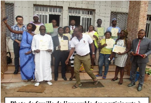
Photo de famille de l'ensemble des participants à la fin de la formation