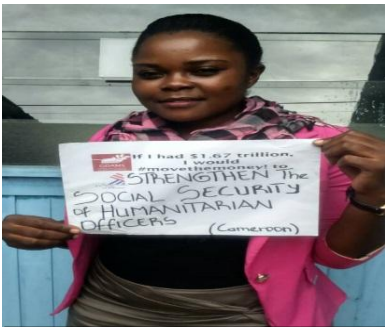
Une participante à la Campagne GCOMS

Ce mouvement a pour but d'amener les gouvernements à investir plus dans les secteurs tels la santé, l'éducation, l'emploi, bref de renforcer les Investissements dans les besoins humains-les droits de l'homme que dans les besoins militaires