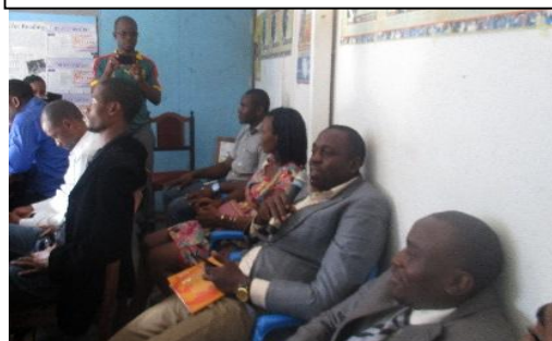
Un aperçu des participants au point de presse

Ce point de presse en date du 05 Juin 2017, s'est tenu au siège de NDH, à Nkol-Eton à 15heures précise. 27 participants parmi lesquels : les représentants des organes de presse ; les Leaders d'OSCs ; des Juristes/Politologues et le Staff de NDH ont pris part à cette initiative centrée sur la thématique « ELECAM et l'insécurité électorale au Cameroun », cette séance d'information entraine dans le cadre d'une enquête de terrain menée par la Société civile sous la houlette de la Plate-forme de la Société Civile pour la Démocratie auprès des responsables et agents d'ELECAM. Ladite enquête fait état des dysfonctionnements managériaux et des violations des droits du personnel au sein de l'institution électoral.